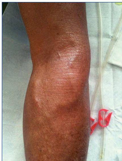
Figura 1. Fístula arteriovenosa humeral izquierda.

bio superior, con diagnóstico de carcinoma epidermoide moderadamente diferenciado de laringe supraglótica, tratado con cirugía y radioterapia coadyuvante. Actualmente está libre de enfermedad y porta traqueostomía pendiente de ser cerrada quirúrgicamente. En diciembre de 2010 inicia DP a través de catéter peritoneal. Al mes presentó peritonitis por Acinetobacter , resuelta con tratamiento antibiótico. A los tres meses presenta nuevo episodio de peritonitis, por Pseudomona aeruginosa , con varias recidivas que obligaron a la retirada del catéter peritoneal y transferencia a HD. En febrero de 2012 se implanta nuevo catéter peritoneal y al iniciar la técnica se produce una fuga peritoneo-pleural con derrame pleural masivo secundario, siendo transferido definitivamente a HD.