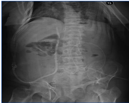
Figura 1. Imagen radiológica que muestra el trayecto del catéter tunelizado, el cual ingresa en vena cava inferior a través de la vena ovárica.

denciaron trombosis de ambas venas yugulares, subclavias, tronco innominado, así como también de ambas venas femorales e ilíacas. Sin la posibilidad de un trasplante vivo relacionado, se decide ingresarla en plan de diálisis peritoneal e inscribirla en plan de urgencia para recibir un trasplante renal de donante cadavérico. Se coloca catéter para diálisis peritoneal, iniciando dicho tratamiento inmediatamente después con el uso de cicladora, y se logra una dosis de diálisis adecuada y con buena tolerancia.