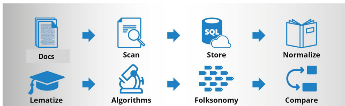
Figura 1 – La solución propuesta por Bismart se basa en un flujo de datos que comienza con la incorporación en la base de datos de conocimiento de los documentos PDF aportados por Hospital del Mar. Sobre estos documentos se aplican procesos de OCR y la definición de los campos que queremos importar de cada documento. Una vez almacenados en la base de datos e identificados los campos, el sistema inicia el proceso de folksonomía, detectando palabras o grupos de palabras importantes en el conjunto de documentos. Una vez que la herramienta Folksonomy ha extraído la información que se necesita para trabajar, ésta se presenta en una Web para que pueda ser consultada, modificada o para ejecutar de nuevo el proceso a petición.

búsqueda antes del inicio de la obtención de información. Por tanto, la folksonomía permitiría resaltar automáticamente las etiquetas de conceptos en lenguaje natural para revelar el contenido interno. La folksonomía es un sistema automático de clasificación en tiempo real, basado en las etiquetas y la frecuencia con la que aparecen y es la única forma viable de poder trabajar con cantidades enormes de documentos. La forma de trabajar de este sistema se conoce como bottom up y la solución Bismart Folksonomy es el primer software que puede gestionar este tipo de clasificación ( https://bismart.com/es/inicio/ ).