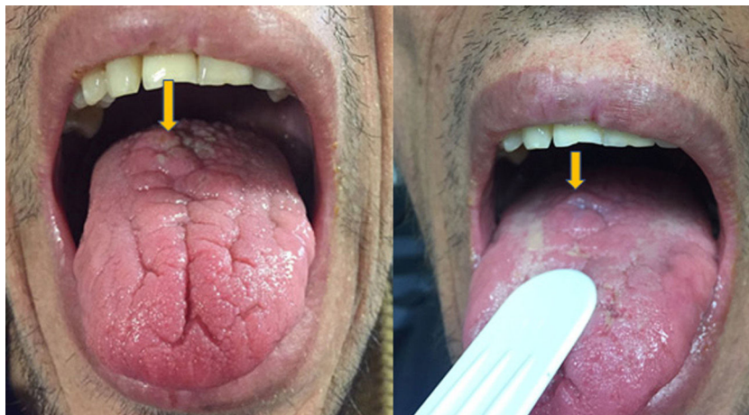
Figura 1 - Lesión en el dorso de la lengua.