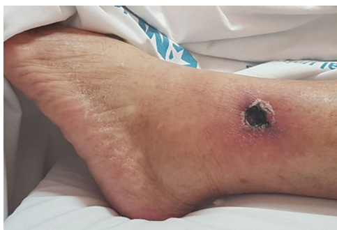
Figura 2 – Lesión ulcerosa en tobillo izquierdo.