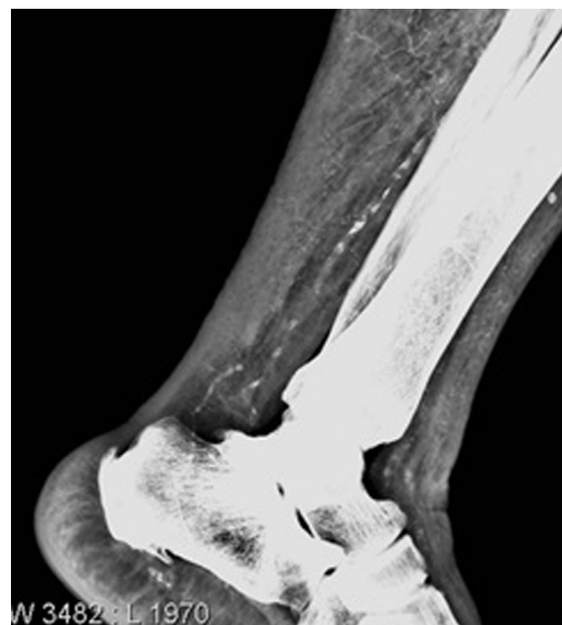
Figura 4 – Radiografía simple de tobillo izquierdo.

Este caso nos invita a considerar la posible implicación de la sobrecarga férrica en la génesis de úlceras cutáneas en pacientes con ERC que reciban hierro iv, tanto por su papel patogénico conocido en la producción de daño tisular como por su posible asociación con otras enfermedades como por