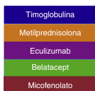
Figura 1 – Evolución de la función del injerto renal y terapia inmunosupresora recibida.