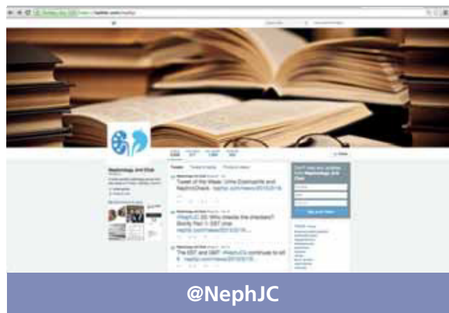
Figura 1. Cuenta de Twitter de @NephJC.

@NephJC es un foro a través de Twitter orientado a nefrólogos y especialidades relacionadas, donde se realiza una revisión crítica y una discusión de publicaciones de interés (figura 1). Está abierto a cualquiera interesado en el tema propuesto. Hasta el momento han participado en las discusiones nefrólogos, residentes de nefrología, cardiólogos, internistas, urólogos, radiólogos y farmacólogos.