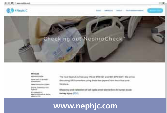
Figura 2. Página web www.nephjc.com .

Las sesiones de NephJC tienen lugar cada dos martes a las 9 p. m. (eastern time) y el siguiente miércoles a las 8 p. m. (meridiano de Greenwich). Una semana antes de la discusión a través de Twitter, los coordinadores anuncian la publicación que se va a tratar junto con más información relacionada en la página www.nephjc.com e invitan a formular comentarios y cuestiones que serán discutidas en directo durante la sesión (figura 2).