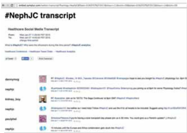
Figura 3. Ejemplo de transcripción de la sesión a través de Twitter del día 7 de enero de 2015.

Al finalizar la sesión, todos los comentarios son recopilados y publicados en la página web (figura 3).