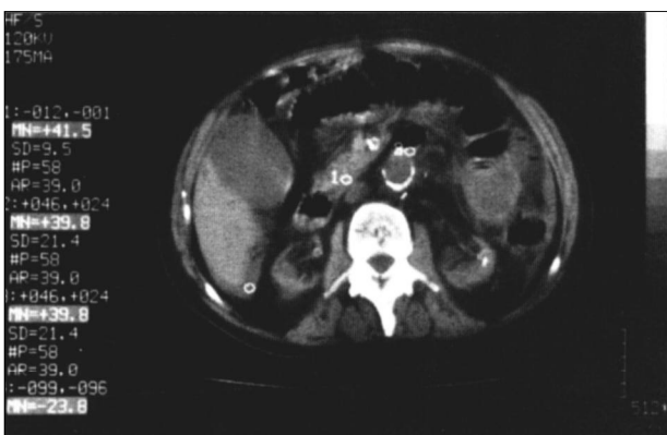
Fig. 1.—TAC sin contraste. Ausencia de plano de clivaje entre la zona yuxtaanastomótica de la aorta abdominal y la 3.ª porción duodenal.

El 21/11/96 ingresó en el Hospital Montecelo por dolor abdominal y melenas. Una endoscopia alta hasta segunda porción de duodeno sólo mostró ligeras erosiones esofágicas. Mediante colonoscopia hasta la anastomosis ileocólica terminolateral se apreciaron restos hemáticos de color negruzco sin detección de puntos de sangrado activo. Se trasladó al servicio de Cirugía Vasculardel Hospital Xeral de Vigo con el diagnóstico de presunción de fístula aortoentérica y sangrado en intestino delgado. Mediante TAC abdominal sin contraste se detectó la presencia de una imagen aérea correspondiente a intestino delgado en íntimo contacto con el extremo proximal de la prótesis aórtica abdominal (fig. 1). Tras la inyección de contraste se apreció relleno del saco aneurismático periprotésico (fig. 2) y aumento secuenciado de densidad en la pared de la tercera porción duodenal y grasa adyacente periaórtica (fig. 3), hallazgos que permitieron inferir el diagnóstico de fístula aortoentérica. El 27/11/96 se intervino quirúrgicamente apreciándose relleno hemático del antiguo saco aneurismático, y se confirmó fístula de la anastomosis aórtica a la tercera porción duodenal. Tras un intento en primera instancia de sutura del punto de fuga se produjo un sangrado masivo inmediato, obligando a realizar clampaje aórtico, sección de la prótesis aórtica con sutura de ambos extremos y, finalmente, implante de un