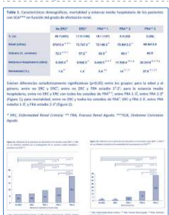
■ Tabla 1 - Figura 1.

La ERC previa como el FRA son infradiagnosticados, en uno de cada tres y uno de cada cuatro pacientes respectivamente, lo que podría contribuir a la elevada mortalidad de estos pacientes.