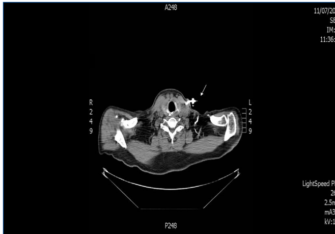
Figura 2. Trombosis de vena yugular (vista transversal). La flecha indica el lugar de trombosis yugular a la entrada del catéter en la vena yugular interna izquierda.