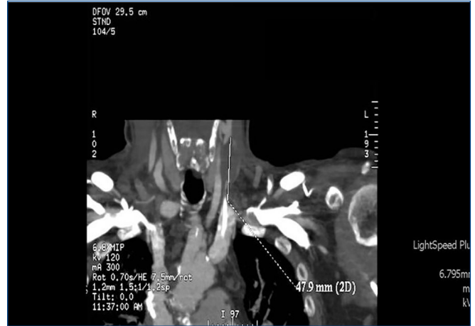
Figura 3. Trombosis de vena yugular (vista frontal). Zona de trombosis de la vena yugular a la entrada del catéter.

La TIH II se define como una caída del 50 % de la cifra de plaquetas con un recuento inferior a 100 \times 10^9/l que ocurre entre 5 y 15 días de la primera exposición. En nuestro ámbito esta entidad no ha pasado inadvertida 6-8 . El considerable riesgo trombótico obliga a actuar con rapidez. El diagnóstico se establece mediante pruebas funcionales y antigénicas. Las primeras, de mayor especificidad: STRA (14C serotonin release assay ), HIPA ( heparin induced platelet activation