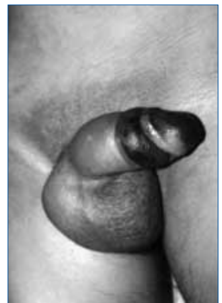
Figura 1. Lesión de aspecto necrótico en el glande.

El tratamiento principal debe consistir en la prevención del cuadro, mediante la monitorización de los niveles de