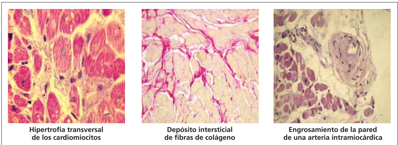
Figura 1. Imágenes microscópicas del miocardio de un paciente con cardiopatía hipertensiva mostrando las tres lesiones fundamentales del remodelado miocárdico. Los dos paneles laterales corresponden a tinciones de hematoxilina-eosina y el central a una tinción de rojo picosirio (las fibras de colágeno aparecen teñidas de rojo).

tipos de evidencias sugieren que la fibrosis miocárdica hipertensiva se desarrolla en respuesta a factores no hemodinámicos 8 . En primer lugar, la fibrosis se produce no sólo en el ventrículo izquierdo, sino también en el ventrículo derecho, en el septo interventricular y en la aurícula izquierda de los pacientes hipertensos. En segundo lugar, se ha demostrado que la capacidad del tratamiento antihipertensivo para reducir la fibrosis en los pacientes hipertensos es independiente de su eficacia antihipertensiva.