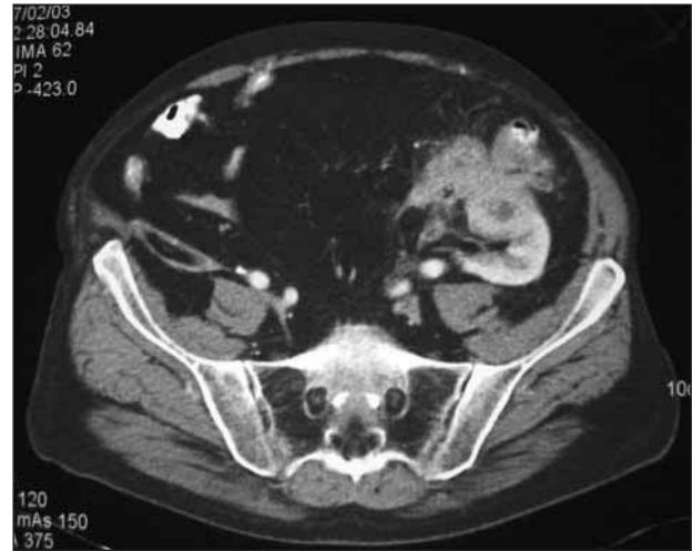
Fig. 1.—Masa a nivel de la unión entre el colon descendente y sigma que infiltra el polo inferior del injerto renal así como la región mesorrenal atrapando incluso la vía excretora.

El Actinomyces israelii es una bacteria saprófita de la boca y del tracto gastrointestinal que se convierte en patógena tras lesión de la mucosa 1 . La actinomicosis es una infección supurativa crónica. La localización cérvicofacial es la más frecuente (aproximadamente en el 50% de los casos), seguida de la localización abdominal en un 20% de los casos aproximadamente, generalmente en el apéndice y región ileocecal 2,4 . La infección tiende a permanecer localizada para posteriormente extenderse por contigüidad disecando los tejidos por