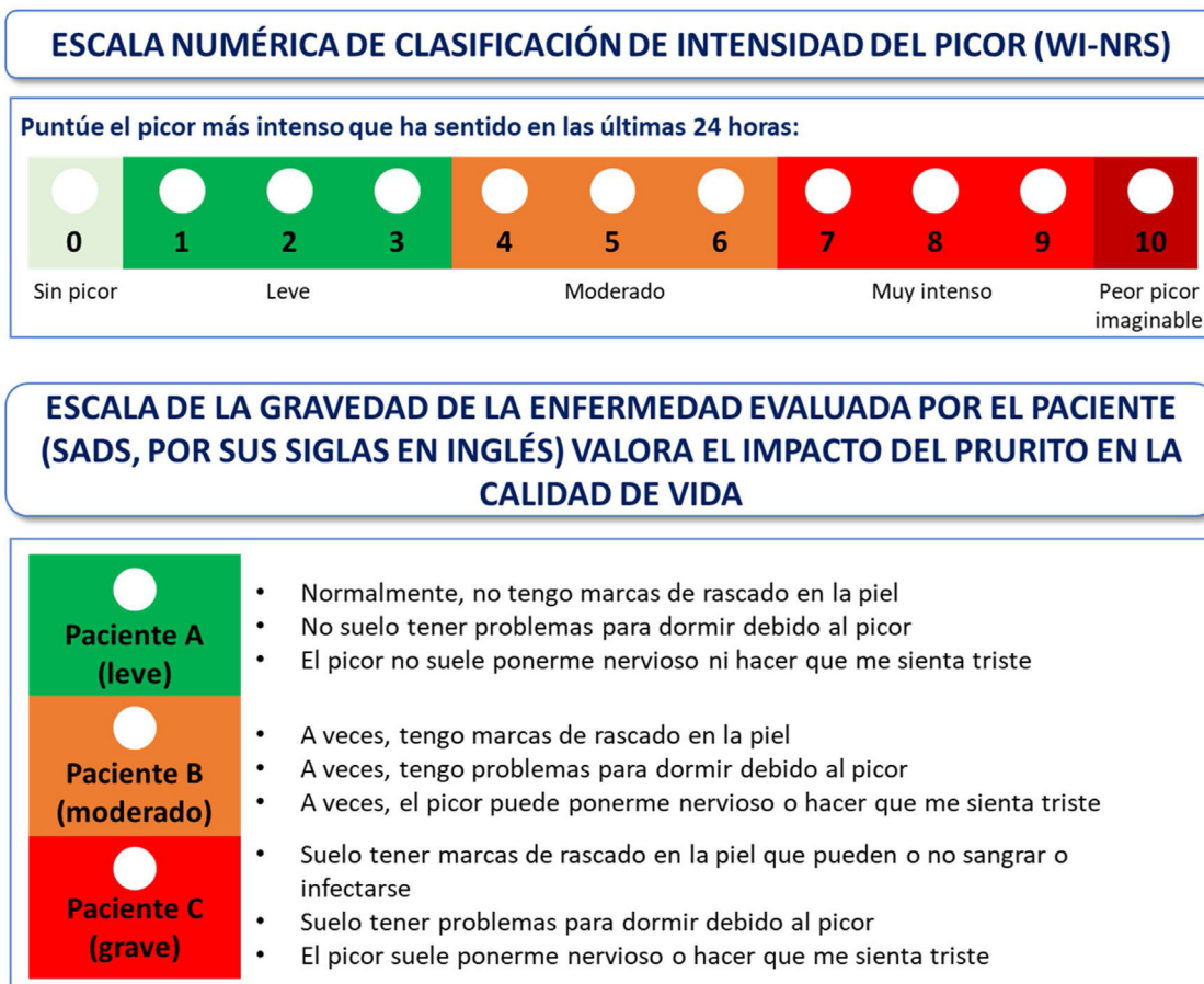
Figura 3 – Escalas de evaluación sugeridas para medir la gravedad del picor 14,15 .

sis. Difelicefalina no está comercializado todavía en España 1 . Dado que actualmente solo está disponible por vía intravenosa y en ensayos clínicos se ha administrado al final de la sesión de hemodiálisis, solamente se podrá aplicar a pacientes en hemodiálisis. Otras opciones a considerar disponibles, fuera de indicación, serían los gabapentinoides, la mirtazapina y/o el montelukast. En una revisión sistemática, 6 de los 7 estudios incluidos registraron resultados favorables en la disminución del Pa-ERC tras la administración de gabapentina. Sin embargo, cabe destacar que el número de pacientes incluidos en estos estudios es limitado y la mayoría de edad es inferior a 65 años 19,20 . Por otro lado, se han registrado efectos secundarios importantes, por lo que el profesional sanitario debería considerar el perfil de riesgo/beneficio antes de usarlos (tabla 6). Igualmente, se deberá tener en cuenta que el uso de gabapentinoides requiere ajustes de dosis y monitorización; además, hay alertas de seguridad y problemas de dependencia, abuso y síndrome de retirada en varios países (Estados Unidos, Reino Unido, Francia y España) 21-24 . Por otro lado, montelukast, un antagonista de los receptores de los leucotrienos utilizado en el tratamiento del asma, rinitis alérgica, dermatitis atópica y urticaria idiopática ha demostrado