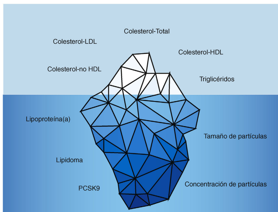
Figura 2 - Parámetros lipídicos tradicionales y no tradicionales.

Los parámetros lipídicos tradicionales se basan en los niveles de colesterol-total, colesterol-LDL, colesterol-HDL, colesterol-no HDL y triglicéridos. Sin embargo, los parámetros no tradicionales, tales como el lipidoma y el tamaño y número de partículas, junto con los niveles de lipoproteína(a) y PCSK9, aportarían una información más precisa sobre el riesgo vascular de los pacientes con ERC.