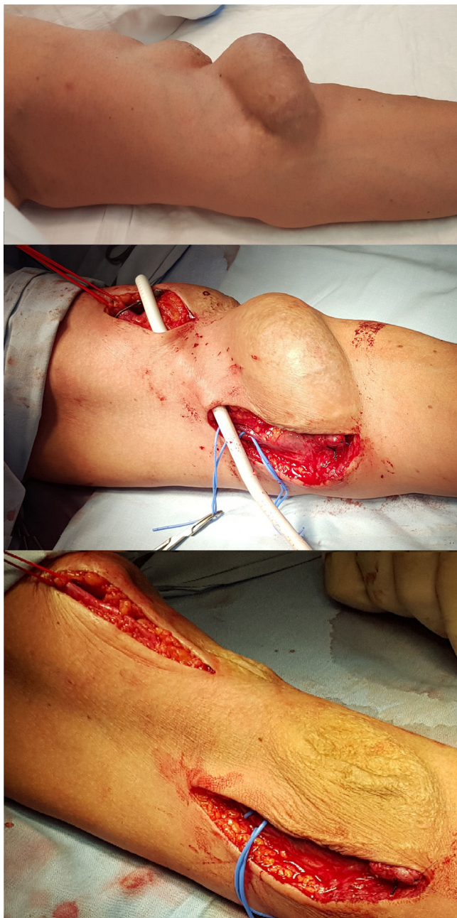
Figura 2 – Caso 4: FAV humerocefálica. Exclusión del aneurisma con puente humerocefálico de PTFE.

con o sin resección, aneurismorrafia, pudiendo precisar de la realización de una nueva FAV autógena o protésica. En caso de que la FAV no vaya a usarse, la indicación es de ligadura 1 .