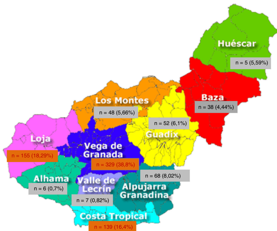
Figura 1 – Pacientes nacidos en Granada con PQRAD en los que se conoce la comarca de nacimiento a 31 de diciembre de 2016 (n = 847).