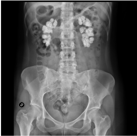
Figura 1 – Rx simple de abdomen con extensas calcificaciones renales bilaterales.

para la deglución y astenia intensa. No presentaba fiebre ni cefalea. En la exploración física la presión arterial fue de 102/72 mmHg, frecuencia cardiaca 75 lpm, saturación de oxígeno basal 98% y el resto de la exploración, normal. La analítica en sangre fue: creatinina 3,6 mg/dl; sodio 141 mmol/l; potasio 4,4 mmol/l; pH 7,43; bicarbonato 24,6 mmol/l; calcio 8,6 mg/dl; calcio iónico corregido 1,16 mmol/l y magnesio 1,9 mg/dl. La paciente fue valorada por el Servicio de Neurología y quedó ingresada a su cargo para estudio. En dicho servicio se realizó test de edrofonio (negativo), TAC cerebral sin contraste (sin hallazgos significativos), EEG (abundantes brotes de actividad paroxística [ondas theta] en región temporal izquierda, con propagación al resto del hemisferio, así como a región homóloga contralateral, formando algunos brotes paroxísticos bilaterales de ondas agudas). Se inició tratamiento con levetiracetam 250 mg/12 h, que resultó insuficiente para el control de las crisis. La paciente evolucionó a status focal, sin respuesta a diazepam (hasta 10 mg) ni a bolos de ácido valproico, por lo que precisó traslado a la UCI. La actividad