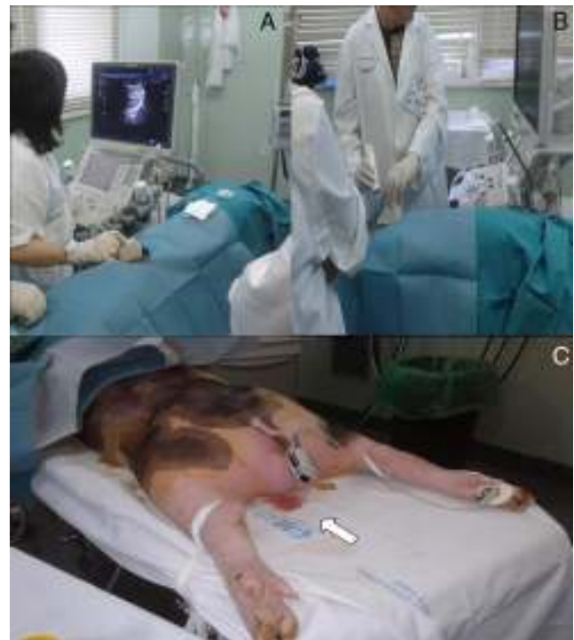
Figura 2 – Modelo animal vivo. A) Dos alumnos visualizando el punto de punción adecuado en el riñón. B) Biopsiando al animal. C) Hematuria macroscópica tras posbiopsia renal en animal (flecha).

Con el modelo animal los alumnos aprenden: