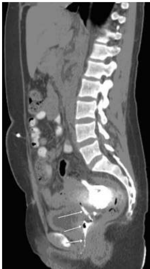
Fig. 1 – Arrows shows vaginal leak.

Patients on CAPD have an increased risk of both hernia formation and dialysate leakage as an intraperitoneal pressure related complications. One of the rare peritoneal fluid leakage is through processus vaginalis 3 and main